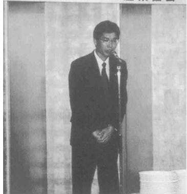
二宮県産業振興課長来賓あいさつ