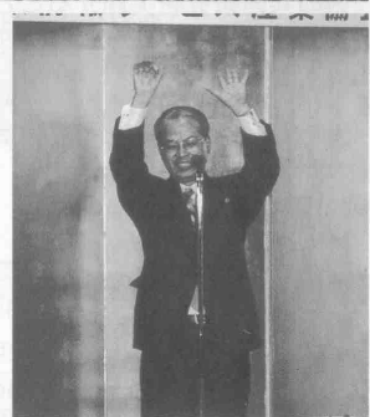
宇都宮協会顧問による万歳三唱