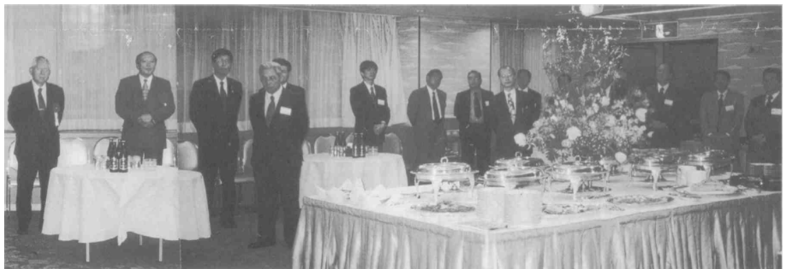
分県情報サービス産業協会 -

なお、パーティ会場では、平成11年11月の県民文化祭に当協会が催したサウンドコンテスト（コンピュータによる作曲編曲のコンテスト）のグランプリ受賞曲がBGMで紹介され、これを聴きながら和やかな歓談が続いた。（総務委員会より）