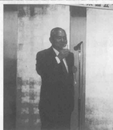
秋月協会顧問による乾杯