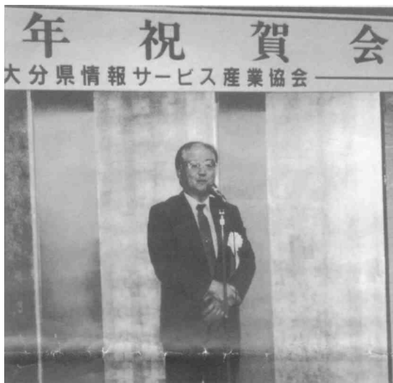
郷司協会会長挨拶 今年も『会員の会員による 会員のための協会』へ

平成12年の新春を迎え、私共県情報サービス産業協会も設立12年を迎えることとなります。これまで協会としてのアイデンティティ確立のために地道に努力を重ねて来られましたのも会員をはじめ関係の皆様のおかげと深く感謝申し上げます。