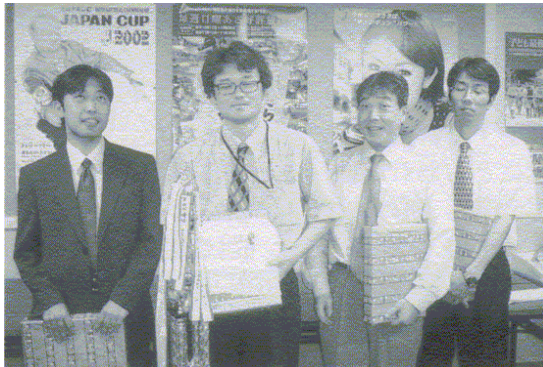
優勝のコンピュータエンジニアリング㈱Aチーム