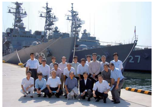
海上自衛隊佐世保基地