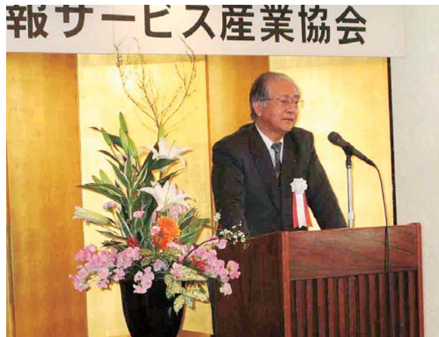
郷司会長新年あいさつ

平成19年のOISA新年例会が、1月22日トキハ会館にて来賓並びに会員企業多数出席の中盛大に開催され、冒頭、郷司会長より新年の挨拶がありました。