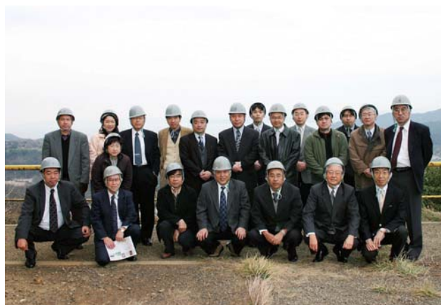
佐賀関製錬所内高台にて