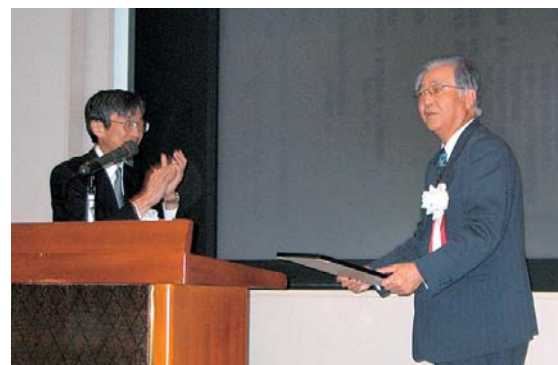
郷司前会長へ 感謝状の贈呈