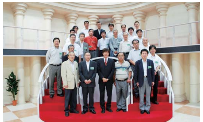
テレビショッピングのスタジオにて