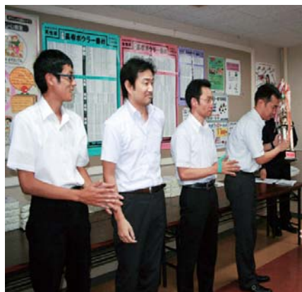
団体優勝チーム表彰