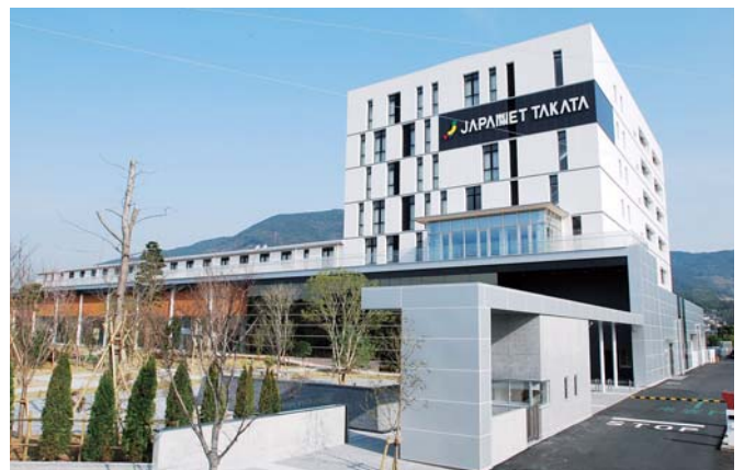
(株)ジャパネットたかた本社ビル

社長自らも出演するテレビショッピングは視聴者からの反応が大きいとのことでした。(企画委員会)