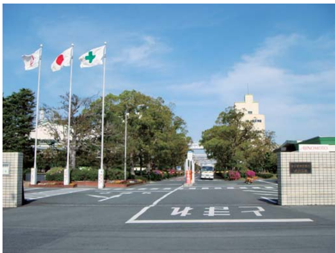
味の素(株)九州事業所正面ゲート