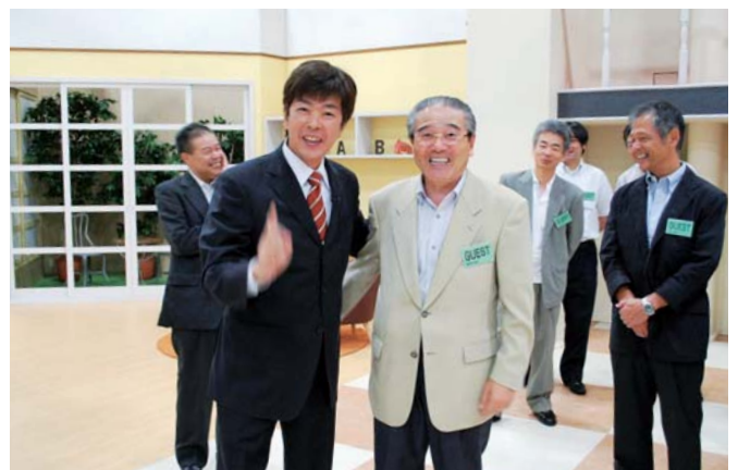
創業者の高田社長(左)と