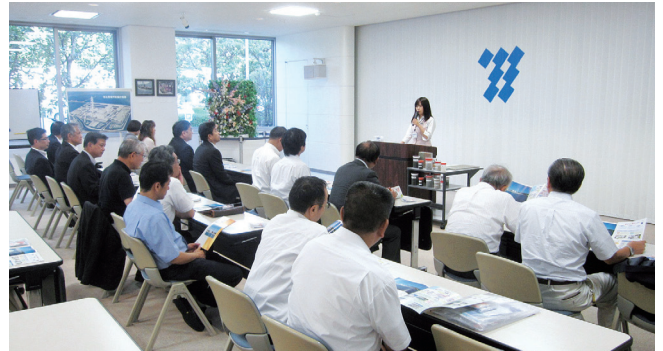
九州電力苓北発電所の説明を受ける