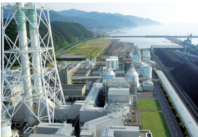
九州電力苓北発電所

九州電力苓北発電所は、石炭専焼の火力発電所で熊本県内の電力需要の約3分の2をまかっています。