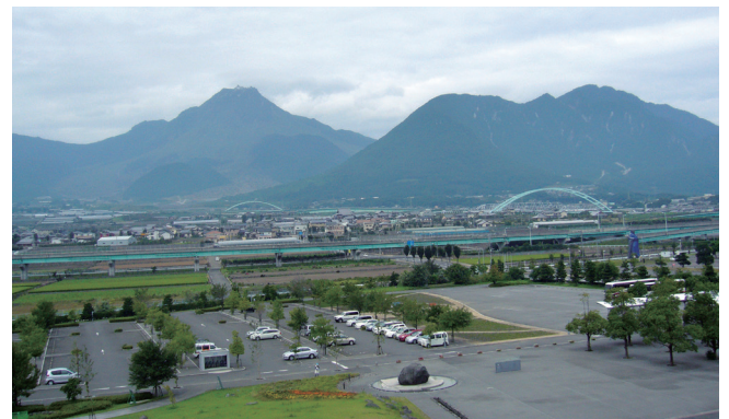
雲仙岳災害記念館から見た現在の雲仙普賢岳

雲仙岳災害記念館は、1990年11月～1996年噴火終息宣言までを後世へ残す日本唯一の「火山体験ミュージアム」です。