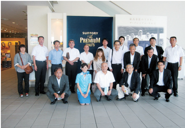
サントリー九州熊本工場前にて

サントリー九州熊本工場は、2003年にサントリービールの第4の拠点として開設されました。